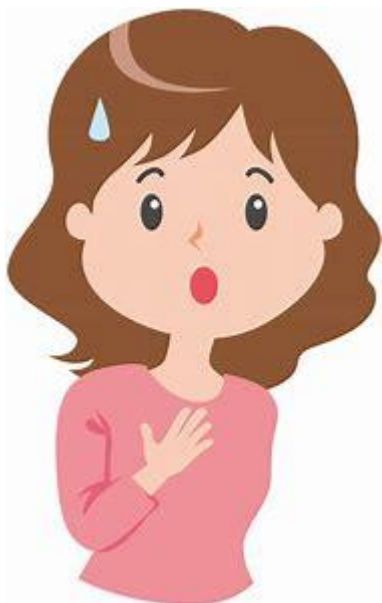
乳がんの10年生存率